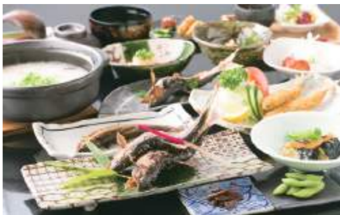
12品の料理が楽しめる大満足の「天然鮎のフルコース」¥7,700