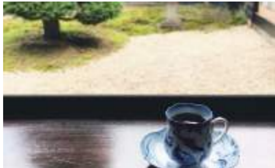
ブレンド/ストレートコーヒー ¥600～