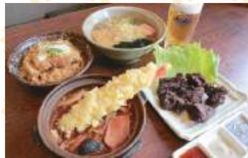
手前から時計回りに／味噌煮込みうどん(天ぷら入り) ¥1,250、かつ丼 ¥1,150、まぜそば ¥920、黒からあげ ¥850