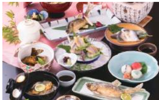
鮎のフルコースが楽しめる「鮎づくしコース」¥7,210(1泊2食付¥18,150)。2日間かけて仕上げる「鮎の甘露煮」は自慢の一品です。