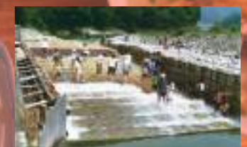
鮎の習性を活かした昔からの漁法「ヤナ漁」。8月解禁後は、ヤナ場にあがることもできます。

0581-58-2217 ● 関市洞戸小坂1712 ● 10:00～17:00※時期により異なる(休期間中不定休) ● 東海北陸自動車道美濃ICより車で20分 ● 300台 ● http://www.horado.net/kankoyana/