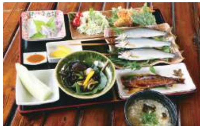
塩焼き3尾、甘露煮、フライ、刺身、雑炊がついたボリューム満点「鮎川コースA」¥4,200